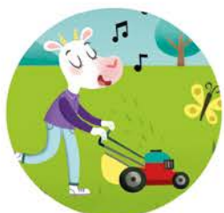
lei taglia l'erba

uno due tre quattro cinque sei sette otto nove dieci