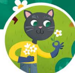
lui raccoglie i fiori