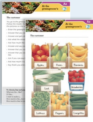
(Aus Let's Role-play!, ©ELI, 2019)